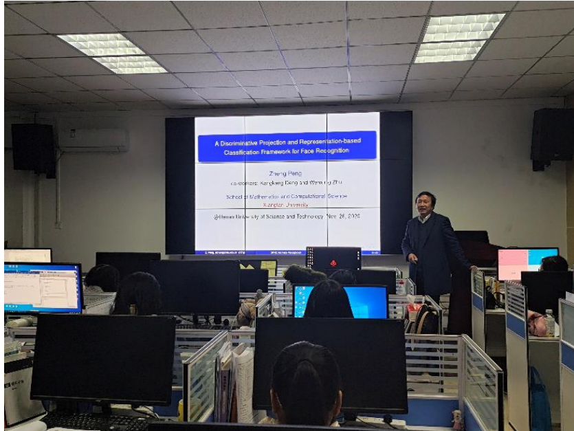
图 2 学术交流情况

《A Discriminative Projection and Sparse Representation-based Classification Framework for Face Recognition》的学术报告。