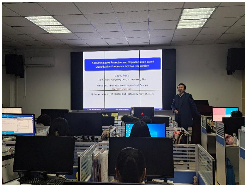
图 2 学术交流情况

中国科学院分子细胞科学卓越创新中心教授、博士生导师，系统生物学重点实验室执行主任，国家重点研发计划首席科学家，陈洛南教授作了题为《基于动态网络标志物的复杂疾病早期预测的方法研究》的学术报告。2020年11月26日邀请湘潭大学彭拯教授到我校作题为《A Discriminative Projection and Sparse Representation-based Classification Framework for Face Recognition》的学术报告。